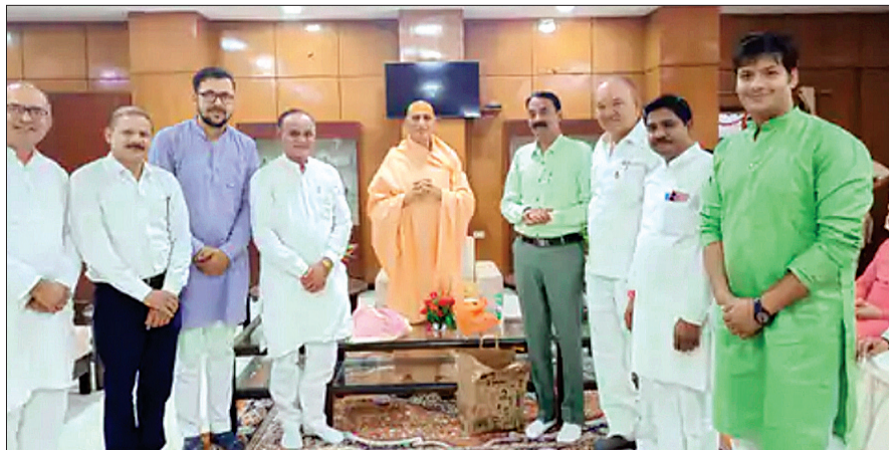
को आशीष वचन के रूप में कहीं। दिव्य पार्वती तट के पड़ाव की महती भूमिका स्वामीजी ने नगर में प्रभु प्रेमी